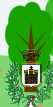
Comune di Villar Focchiardo